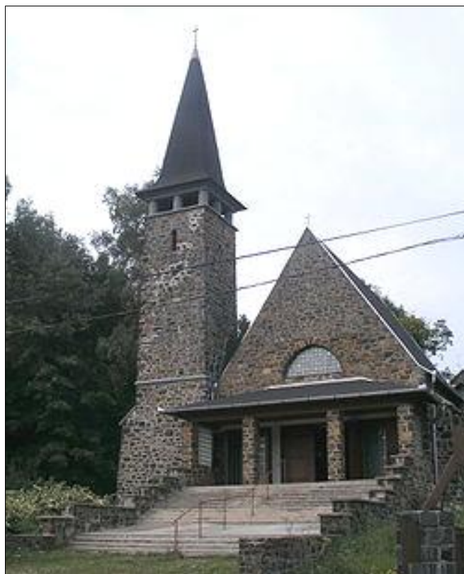
Galyatető katolikus templom