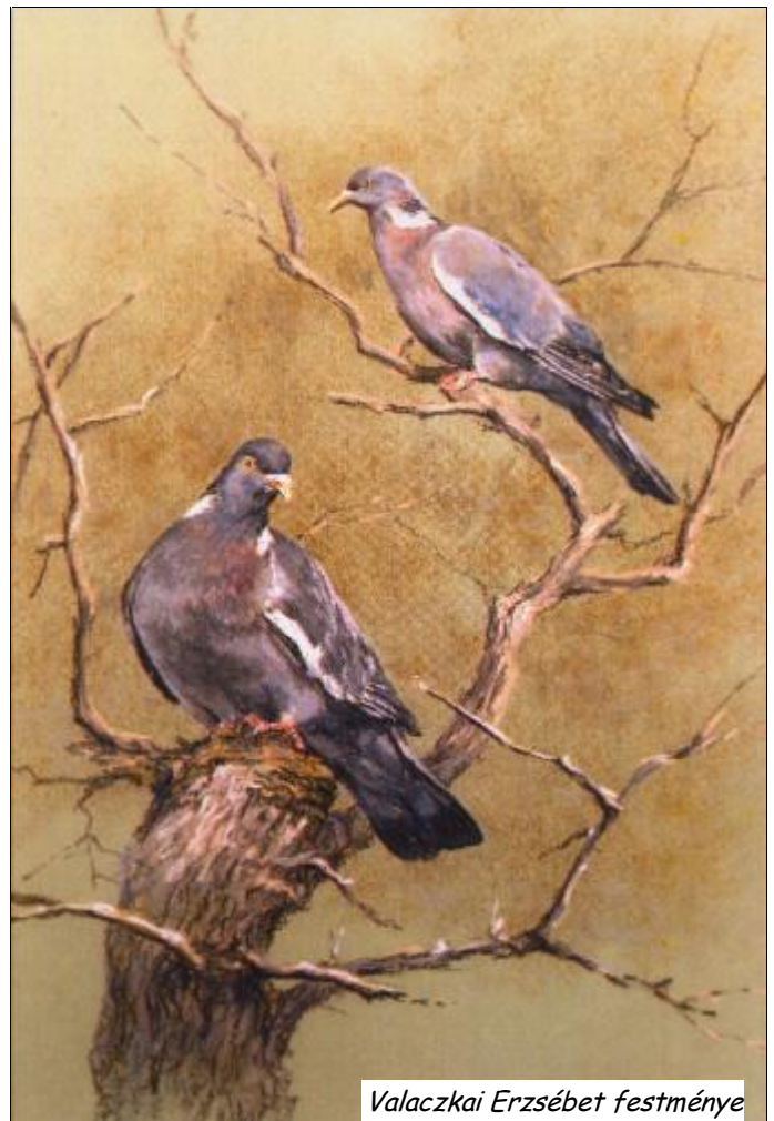
Valaczkai Erzsébet festménye